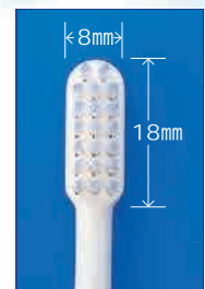
ビークイーン<実物大>

極細特殊加工毛テクノロジーをより進化させて、ついに「NEWスリム毛」が誕生。極細毛が先端でさらに超スリムになり、しかもこれまで困難とされてきた、植毛の高さの均一化を実現しました。従来毛先が届きにくかった隣接面、歯頸部、小窩裂溝にスムーズに到達し、プラークコントロールに威力を発揮。また、歯肉へのストレスを最小限に抑えます。