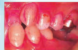
ビークイーン95のブラッシング効果

毛の長さが9.5mmのNEWスリム毛です。毛材の先端は極細で、しかも高さの均一な植毛が裂溝部や歯頸部などの歯垢を除去。歯肉炎の予防にも高い評価を得ています。