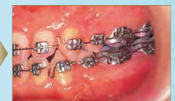
ビークイーン105のブラッシング効果