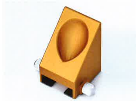
咀嚼運動理想軌道ガイドテーブル