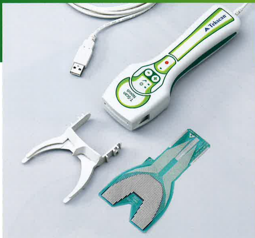
センサーインジケター