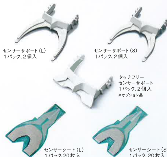
センサーサポート (L) 1パック、2個入