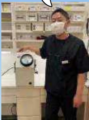
撮影協力：愛知県 あさい歯科医院