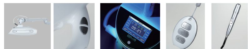
① 可動域360度のラジアルアーム ② 視認性に優れたTUIコントロールパネル ③ ワイヤレスリモコン ④ LEDキュアリングライト