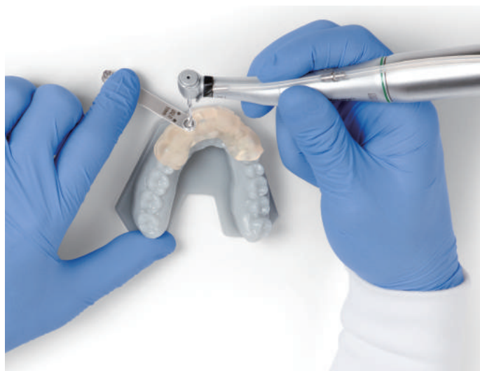
サージカルガイド用材料使用例