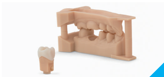
デンタル模型用材料使用例